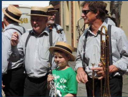
Marcus zoon.....goe bezig