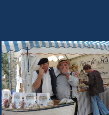
Met de snuut tiegen den drood